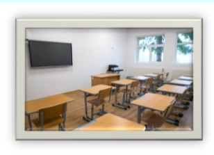
SALĂ DE CLASĂ